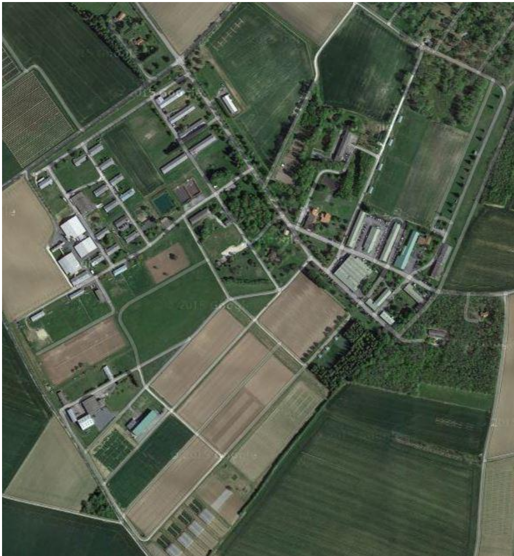
Figure 1: Vue aérienne du site INRA du Magneraud

L'Unité expérimentale Elevage Alternatif et Santé des Monogastriques (EASM) est au service de deux départements de l'INRA : PHASE et SA. Le département pilote de cette unité est PHASE. L'unité est rattachée au Centre INRA POITOU-CHARENTES. L'ensemble de ses bâtiments sont situés sur le site du Magneraud sur la commune de Saint Pierre d'Amilly près de Surgères en Charente Maritime (confère le plan ci-dessous).